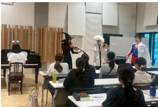
2025年6月18日 授業の様子 6月23日実施チームのランスルー