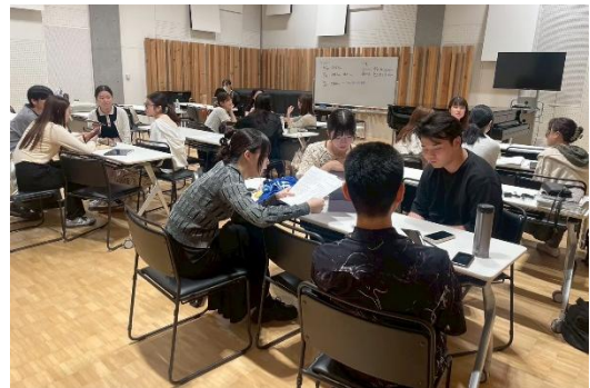
2025年6月11日 授業の様子 企画会議の様子