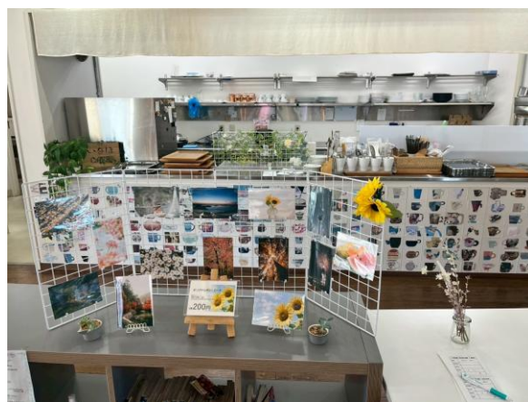
写真2：カフェの厨房とマグカップの壁紙