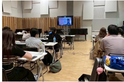
2025年5月28日 授業の様子 北保育園とZoomでの打ち合わせ