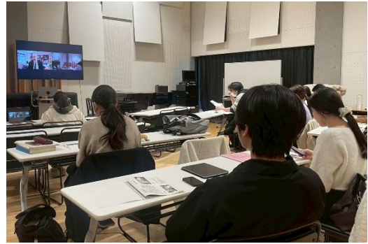
2025年11月19日 授業の様子 石原慎先生（藤田医科大学医学部教授） による講義