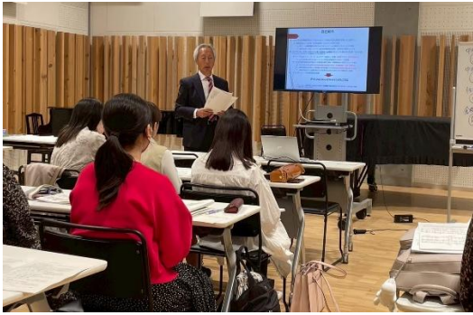
2025年5月7日 授業の様子 スーパーバイザーによる講義