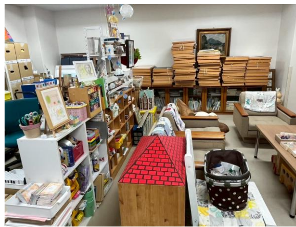
写真4：ボランティア室