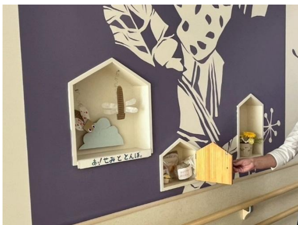
写真1：院内の壁に設けられた「ニッチ」

参考ウェブサイト：四国こどもとおとなの医療センター ホスピタルアート紹介ページ https://shikoku-mc.hosp.go.jp/hospitalart/index.html