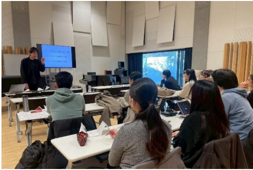
2025年11月26日 授業の様子 プロジェクト副代表による講義