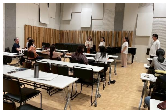
2025年7月23日 授業の様子 7月24日実施チームのランスルー