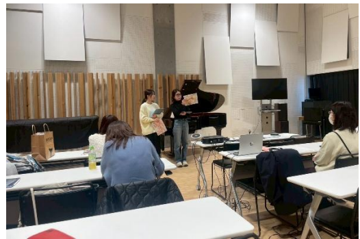
2026年1月28日 授業の様子 2月6日実施チームのランスルー