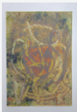
「sweet and warm」2021 297×210 銅版画、デジタルプリント