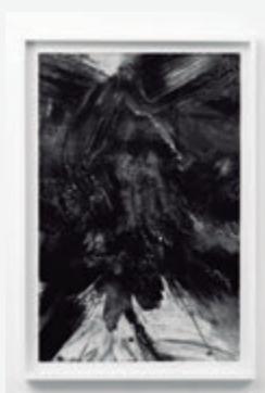
「tree」2021 1100×750 銅版画

2019 年 第 44 回全国大学版画展 (東京) 2021 年 第 8 回山本鼎版画大賞展 (長野) 2021 年 第 5 回アワガミ国際ミニプリント展 (徳島)