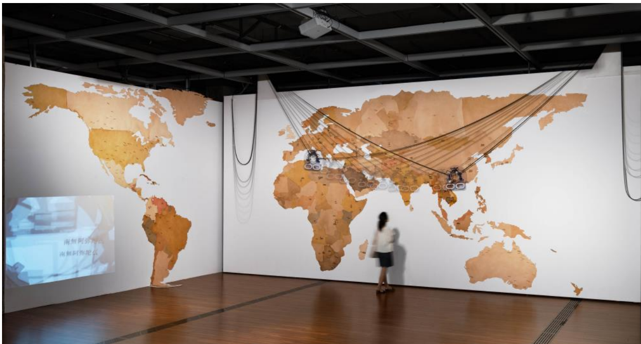
「The Scorched World」 Cowhide, vertical plotter, laser engraver, MCU, camera, projector, 4×14×(h)0.24m, 2019