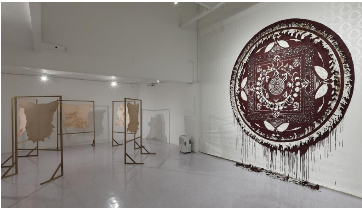
Left: 「Innumerable Disaster and Birth of One Life」 Ironing on sheep/goat leather about 1m×1m×5pcs, 2020