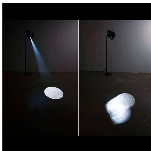
チョウ・ヘナ 《The Subtle Movement》

多くの方にご覧いただきたく、是非ともお取り上げいただけますよう、よろしくお願い申し上げます。