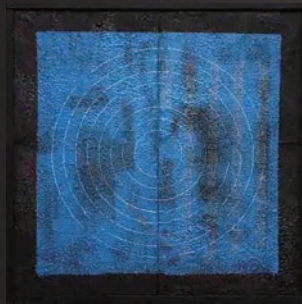
《Blueprint Solar System》