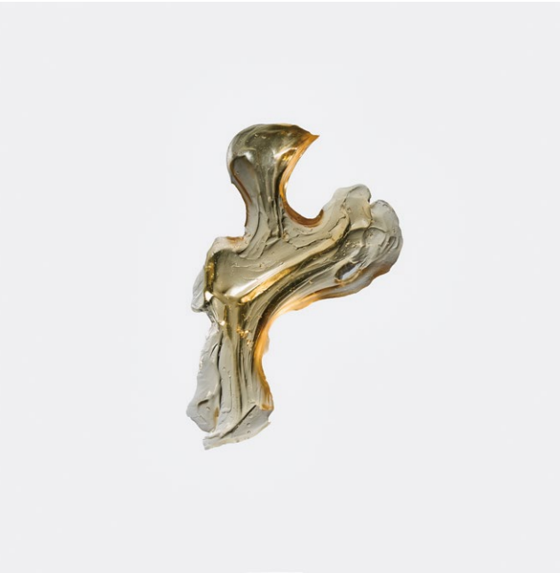
イ・ミンハ 韓国在住 美術作家

2013年、東京芸術大学大学院美術研究科先端芸術表現専攻博士号取得。2010年、東京芸術大学大学院美術研究科先端芸術表現専攻修了。2007年、ソウル大学校大学院東洋画科修了。主なコレクションとして、バウハウス・デッサウ財団（ドイツ）、釜山現代美術館、ソウル特別市文化本部博物館科、秀林文化財団、仁川文化財団、ギャラリー平綿など。