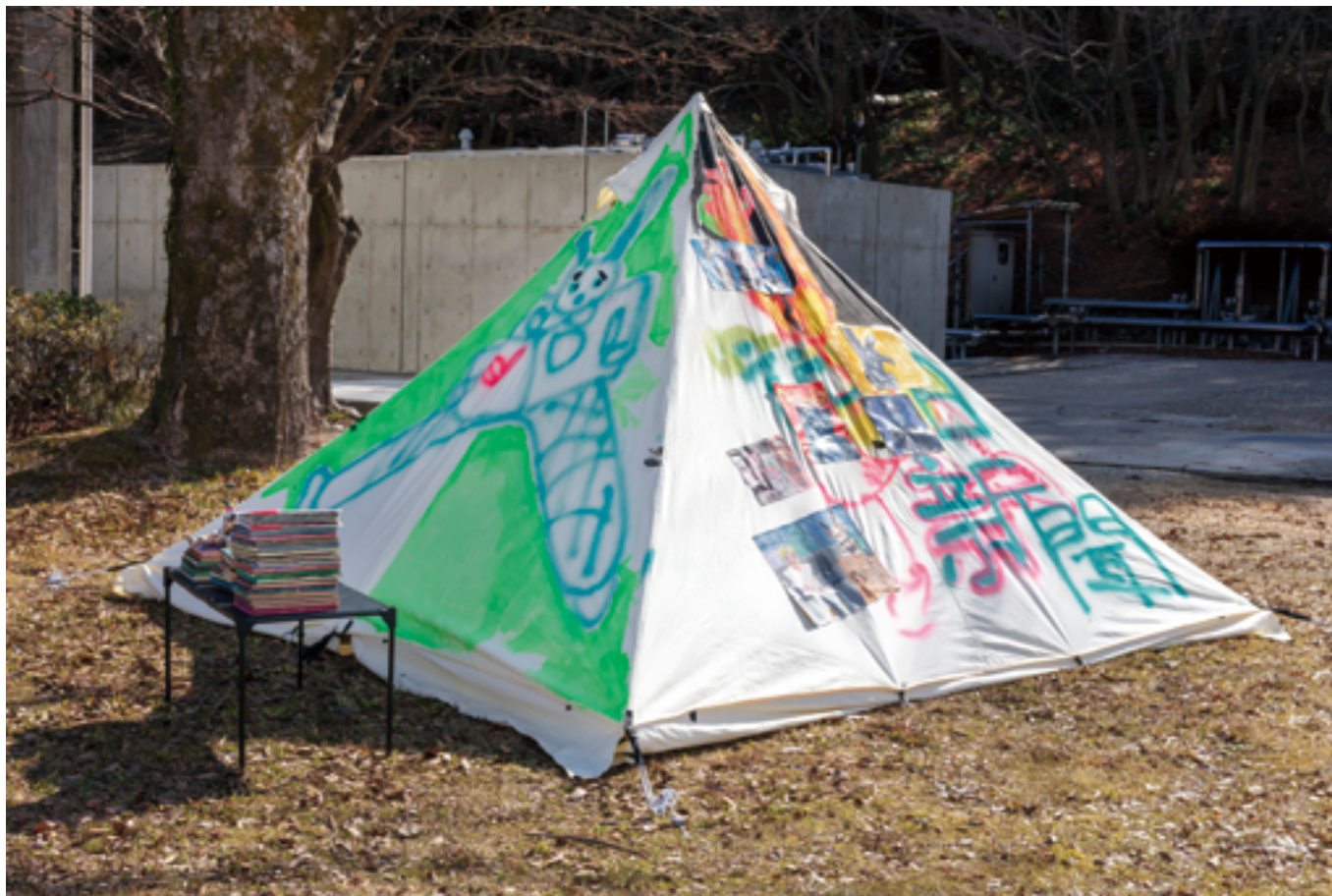
楊 琚 YANG JUN