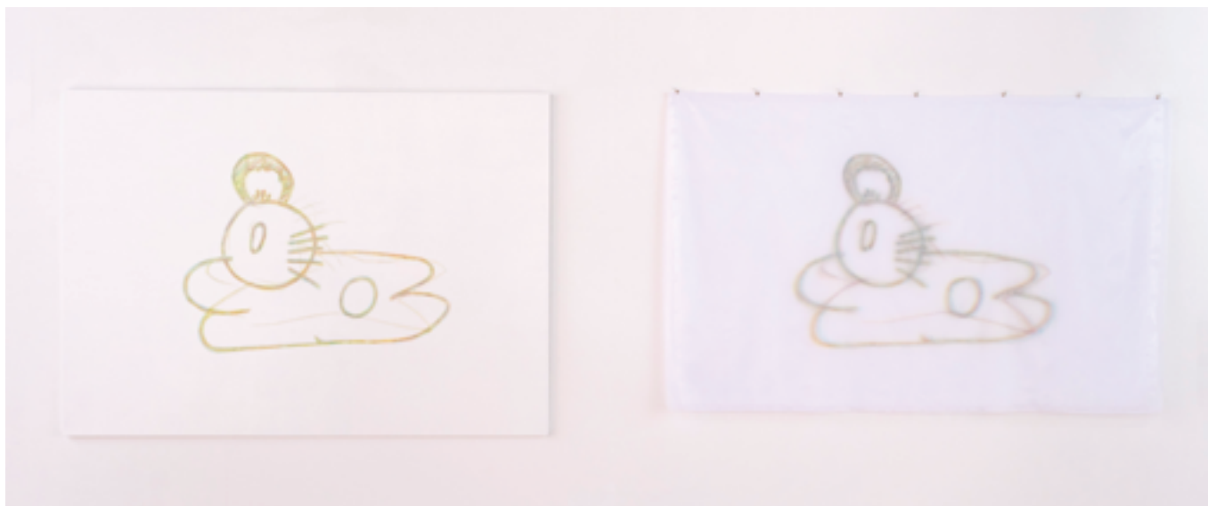
福岡 由那 FUKUOKA Yuina