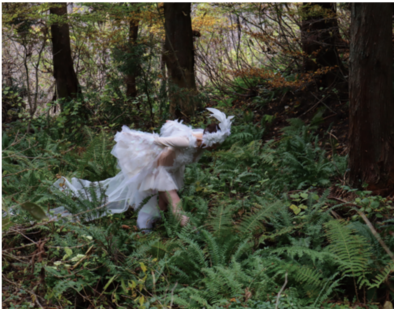
鄭瑶瑶 ZHENG Yaoyao