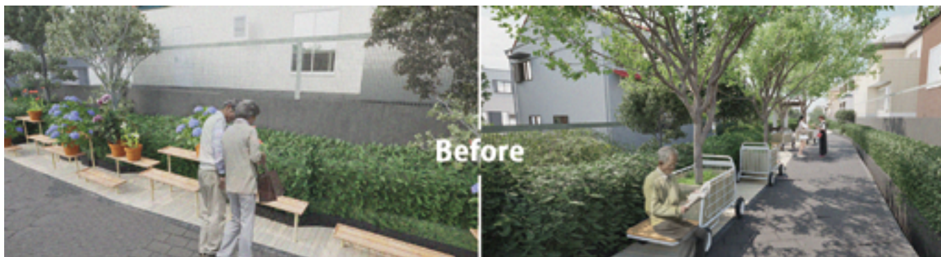
市民ニーズによって、仮デザインの変化（予想）